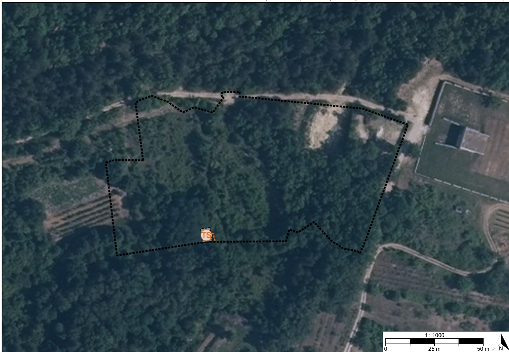
Postupak izrade i donošenja prostornog plana Urbanistički plan uređenja turističkog područja "Brigi"